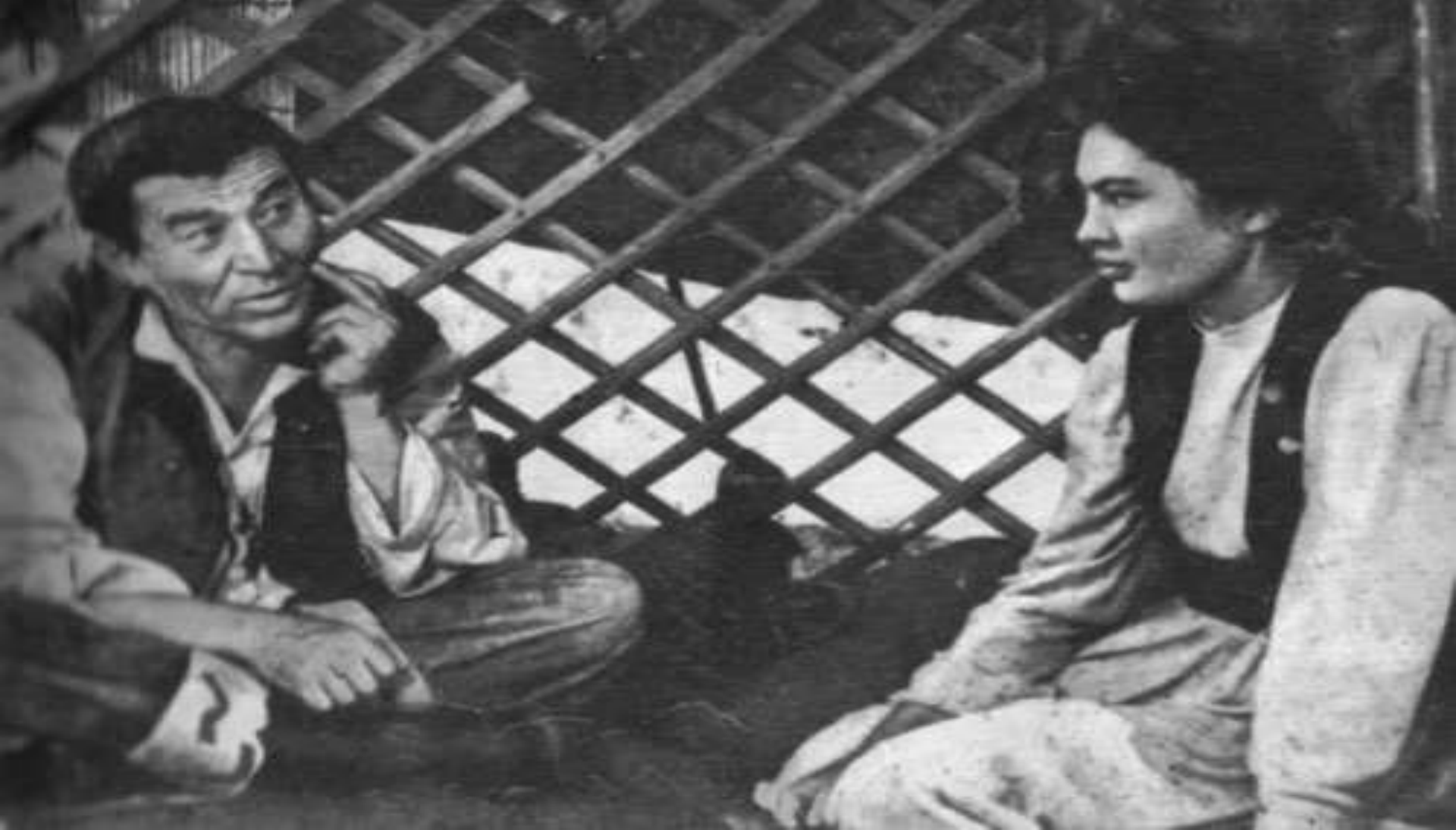
Шәкен Айманов - Алдар көсе ролінде