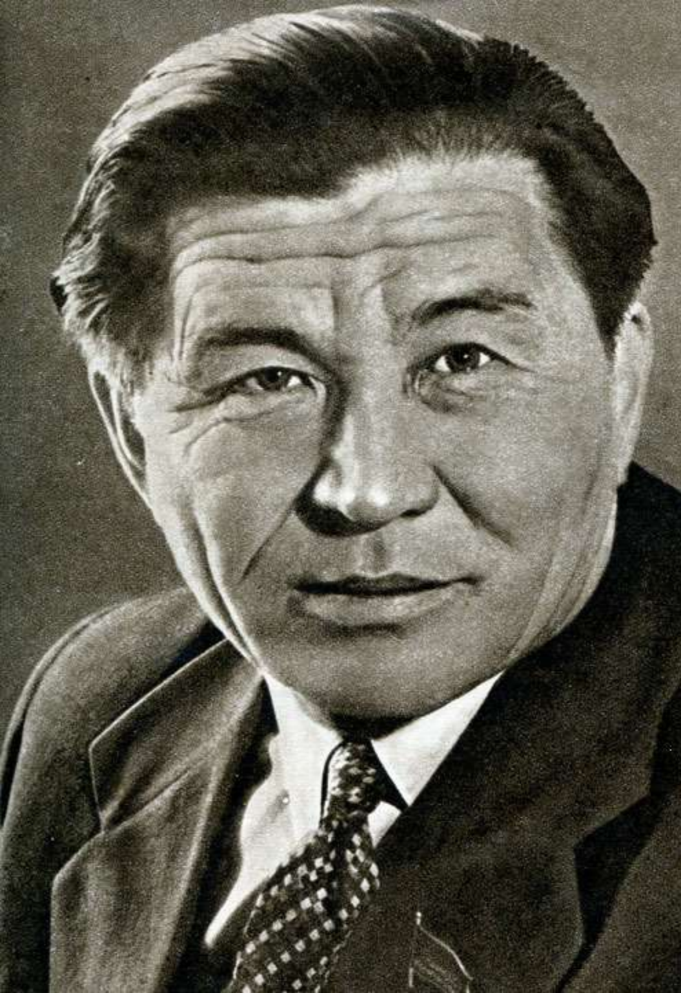
Шәкен Айманов 1914 – 1970жж.